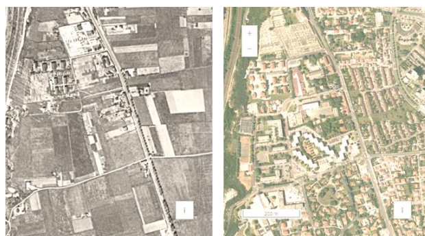
Vénissieux (69) – 1954/2020

La question clé se dévoile au fil de ces pages : Comment se loger sans s'étaler ?